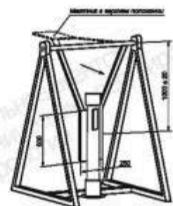
ЧЕРТЕЖ ИСПЫТАТЕЛЬНОГО СТЕНДА

Проведенные испытания доказали полное соответствие нового серийного столбика С3 ГОСТ 50970-2011.